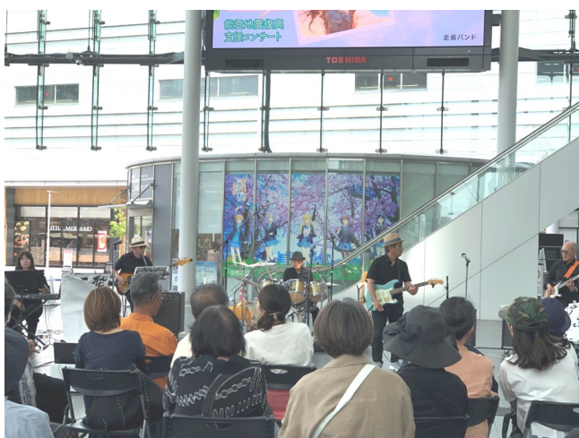
マダムフェニックス・走坂バンドの皆様